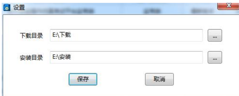
图 4 设置界面